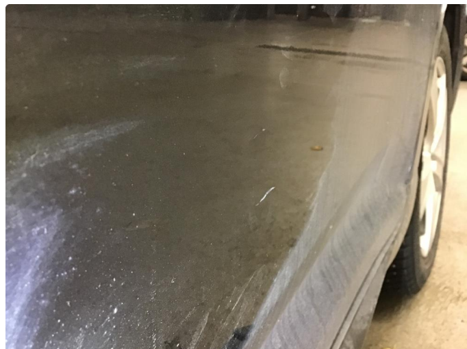
1.2 Liten bulk på bakdør vs.