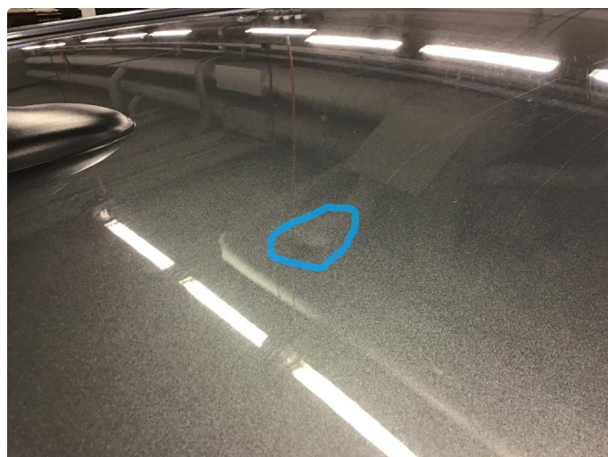
1.4 Liten bulk på taket i bakkant.