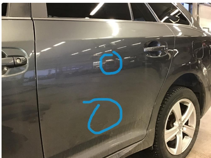
1.2 Liten bulk på bakdør vs.