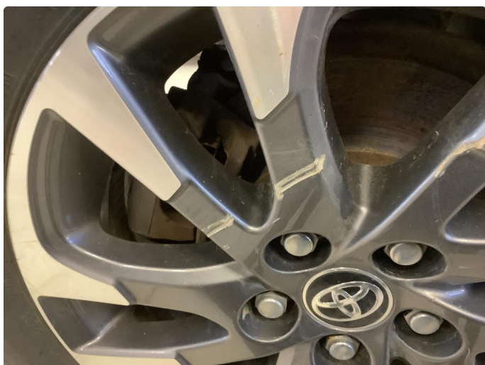
1.3 Kantkjørt felg