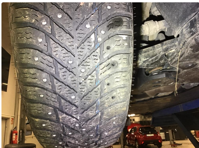
1.2 Skiftet 2 piggdekk og 4 sommerdekk