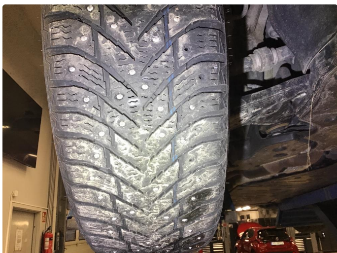
1.2 Skiftet 2 piggdekk og 4 sommerdekk