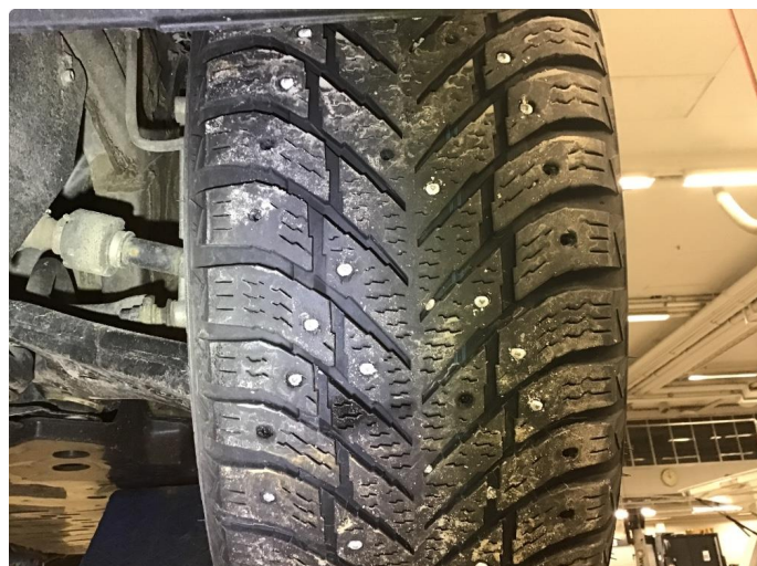
1.2 Skiftet 2 piggdekk og 4 sommerdekk