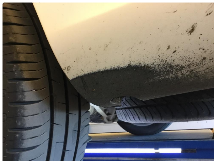
1.1 Lakkslitasje på støtfanger