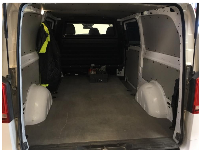
2.1 Noe slitasje i varerom