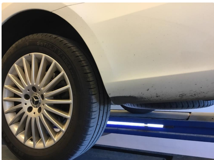
1.1 Lakkslitasje på støtfanger