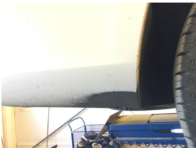
1.1 Lakkslitasje på støtfanger