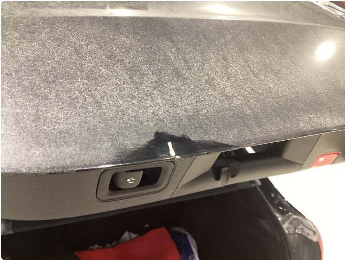
1.1 Ubetydelig lakkskade, korrigeres