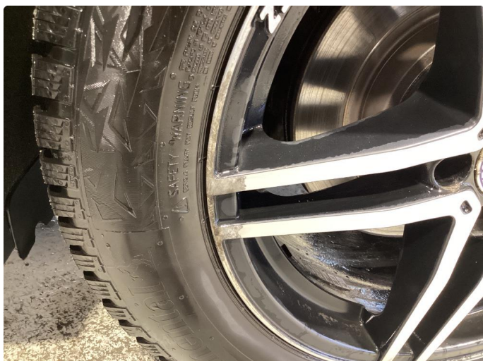
1.1 Småskader på felger