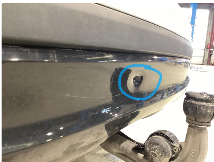
1.2 Bulk etter hengerfeste i bakfanger