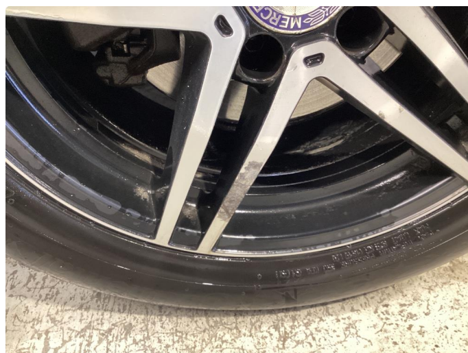
1.1 Småskader på felger