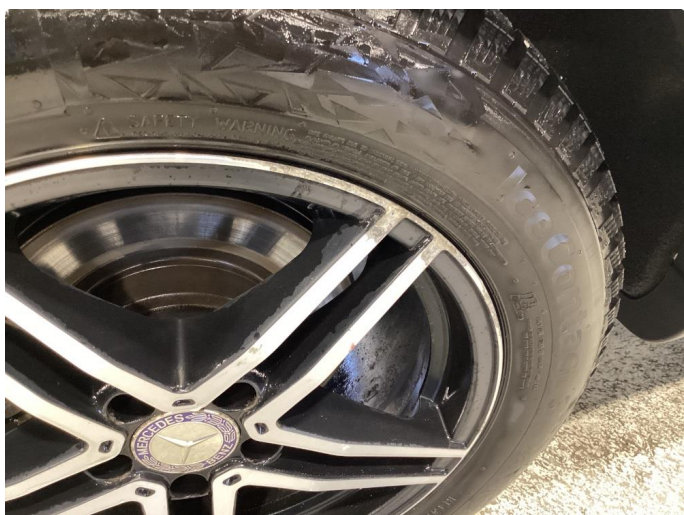
1.1 Småskader på felger