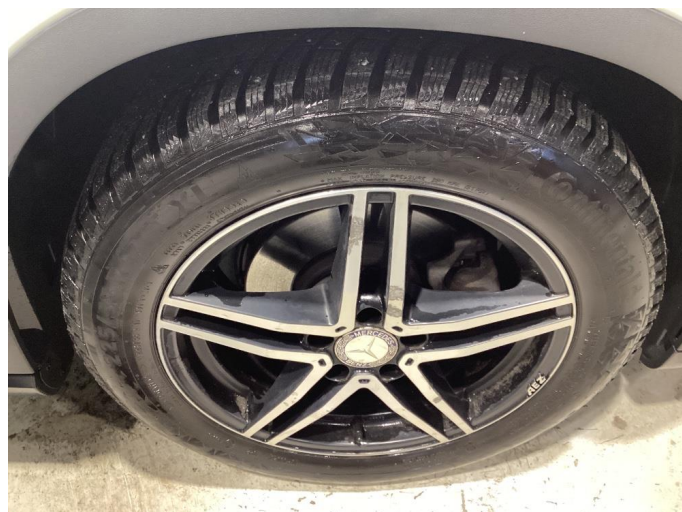
1.1 Småskader på felger