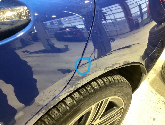
1.1 Liten ubetydelig bulk