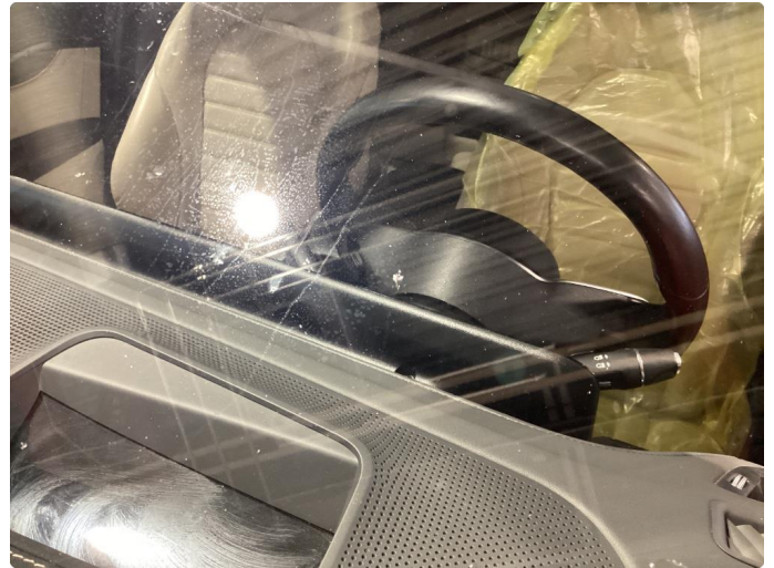
1.2 Reparert steinsprut på frontrute