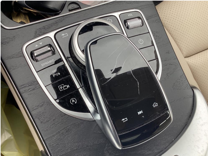
1.1 Riper i touchpad