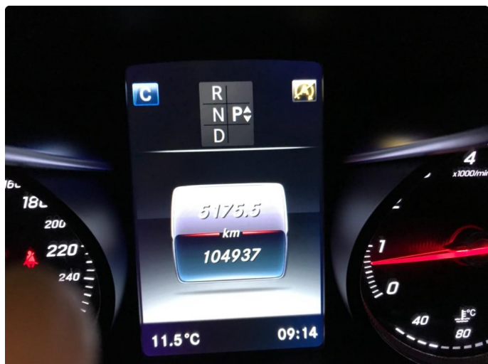
1.1 Service etter bilens intervall ikke fulgt (service utført)