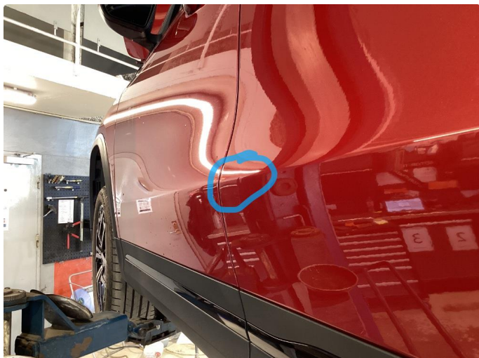
1.1 Liten bulk på dør