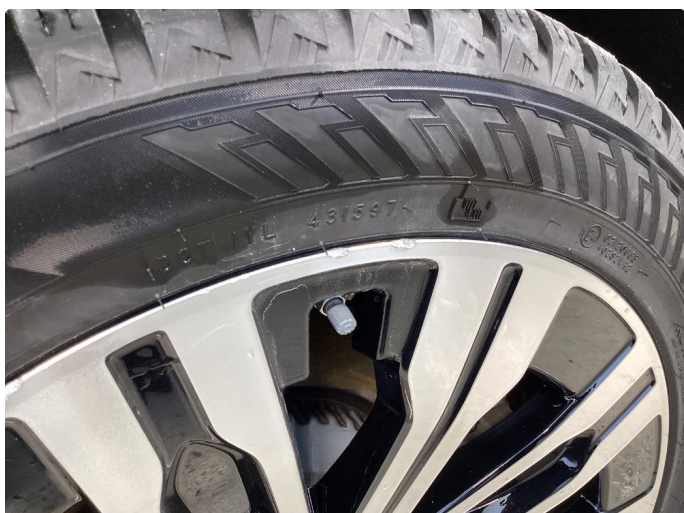
1.2 Ubetydelig kantkjøring felg