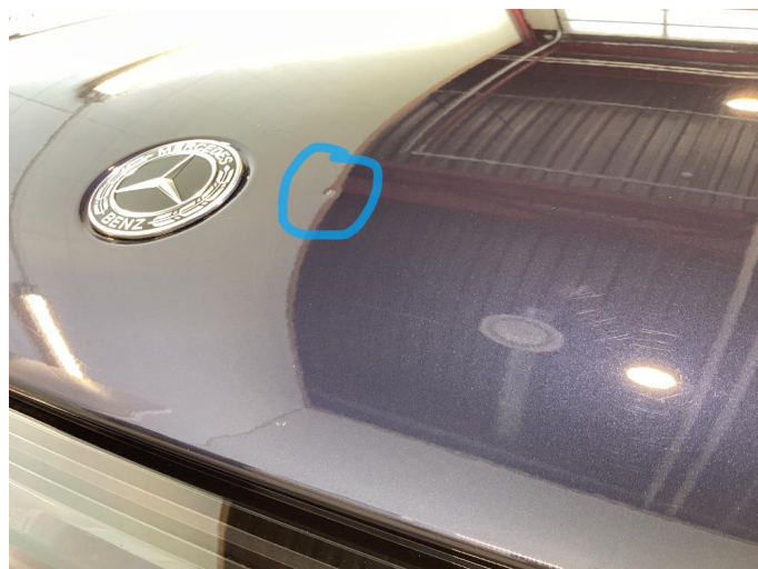
1.1 Liten stensprut i panser