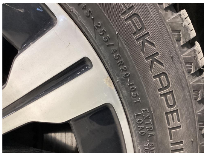
1.2 Ubetydelig kantkjøring felg