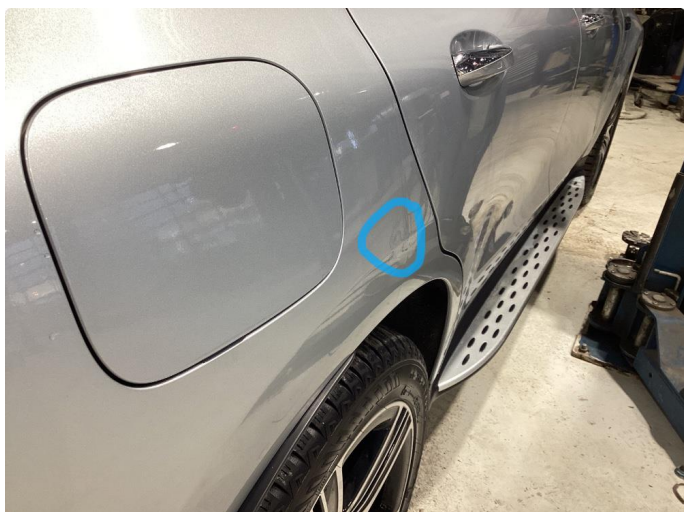
1.1 Liten parkeringsbukk