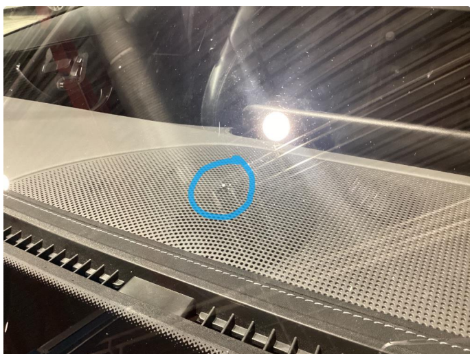
1.2 Reparert steinsprut