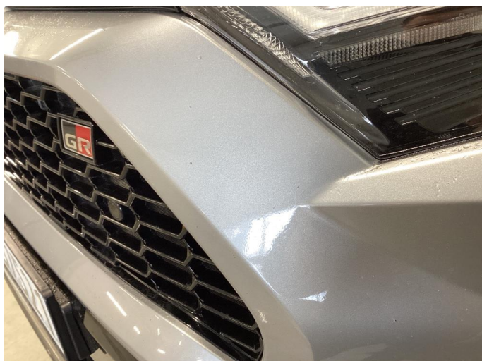
1.1 Små steinsprut på støtfanger foran.