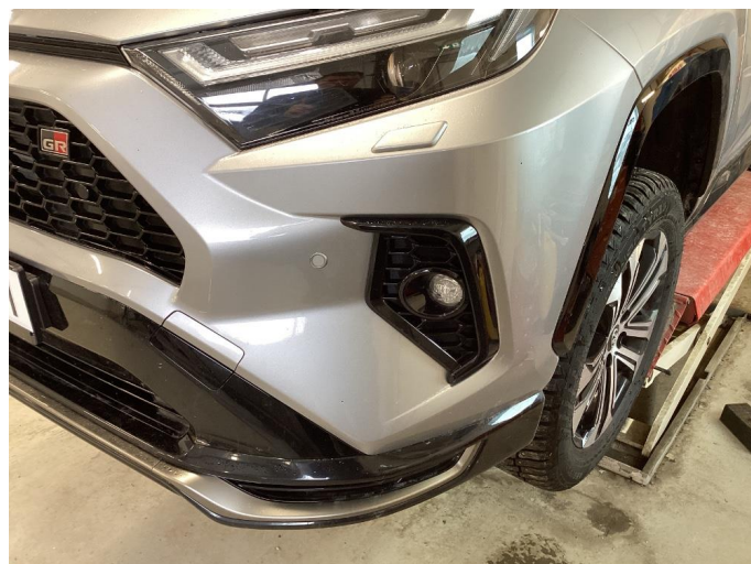
1.1 Små steinsprut på støtfanger foran.