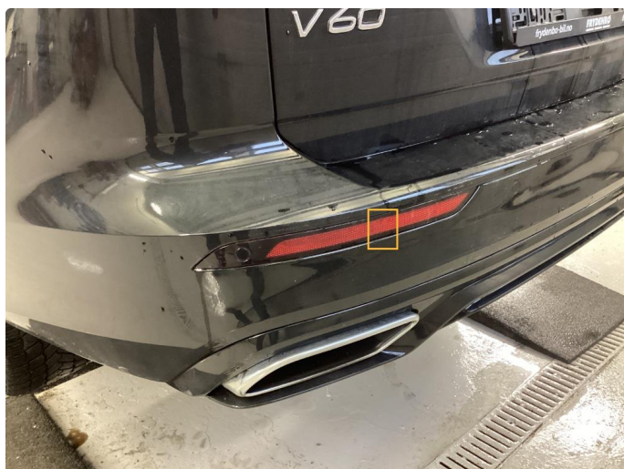
3.1 Øvrige feil OK