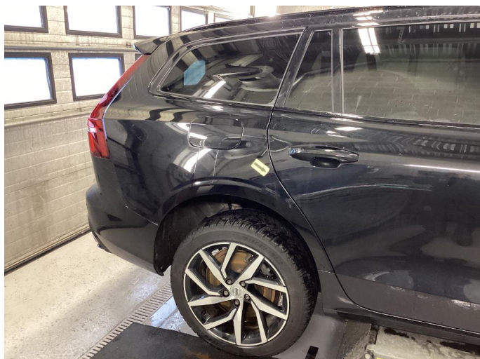
2.2 Bulk. OK