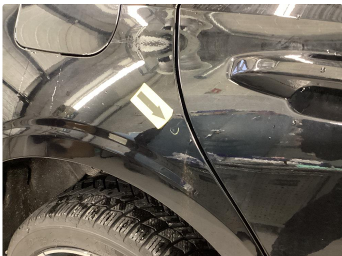
2.2 Bulk. OK