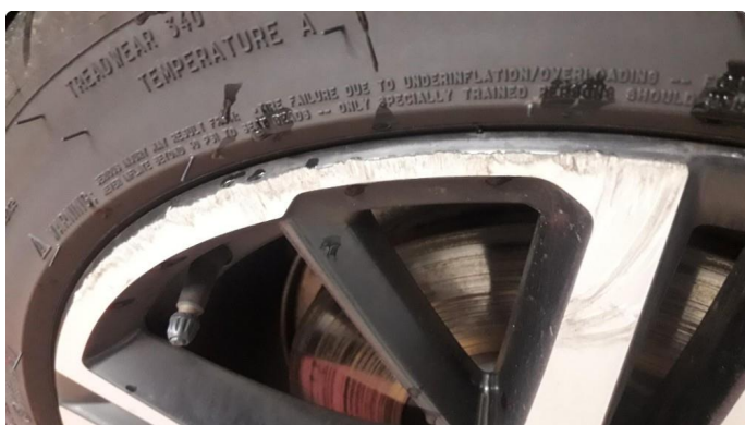
1.1 Skade på felg OK