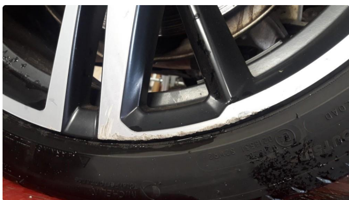
1.1 Skade på felg OK