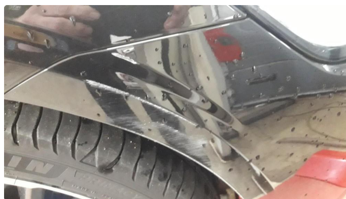
1.2 Ripe(r) ned til grunning OK