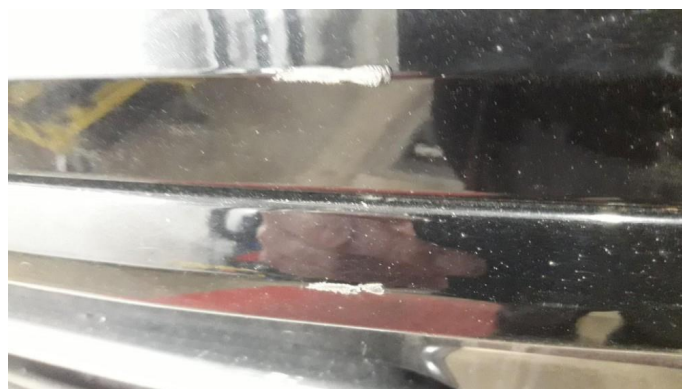
1.3 Ripe(r) ned til grunning OK