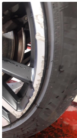
1.1 Skade på felg OK