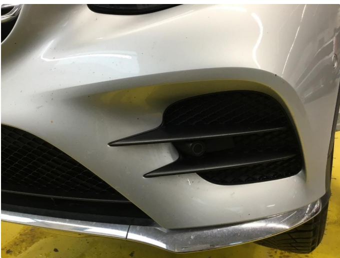
1.5 Noe steinsprut