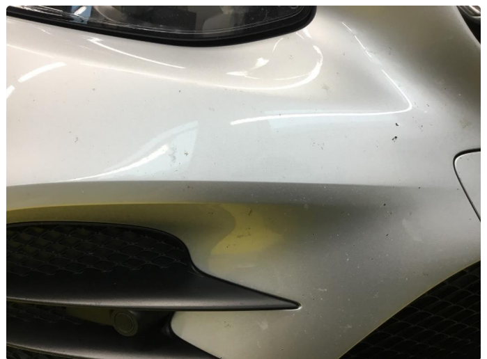
1.5 Noe steinsprut