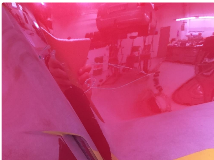
1.1 Noen riper og småbulker