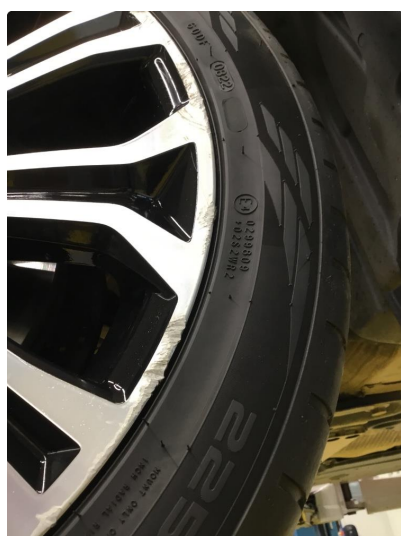
1.2 Skade på felg