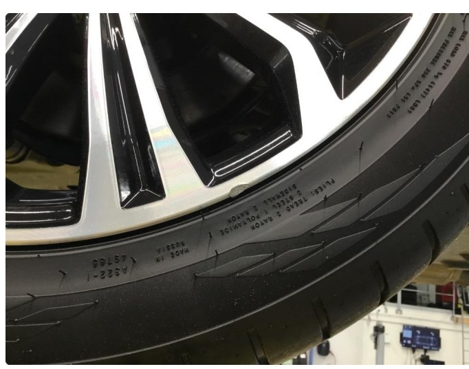
1.3 Skade på felg