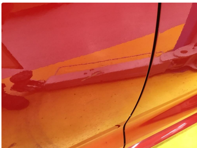
1.1 Noen riper og småbulker