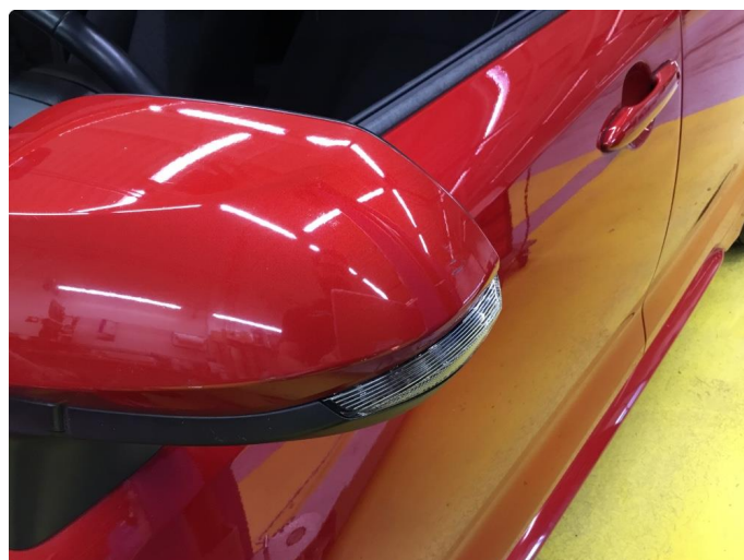
1.1 Noen riper og småbulker