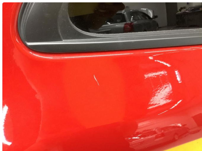
1.1 Noen riper og småbulker