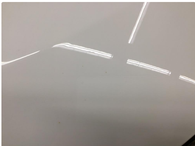
1.5 Øvrige feil