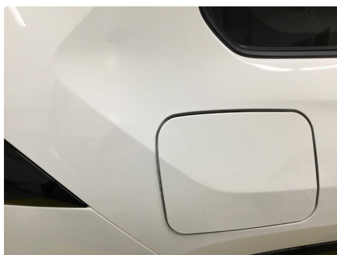
1.2 Øvrige feil