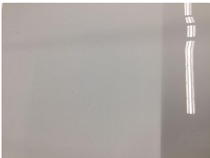
1.4 Øvrige feil