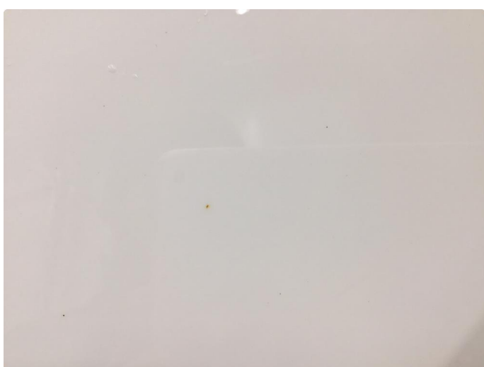
1.2 Øvrige feil