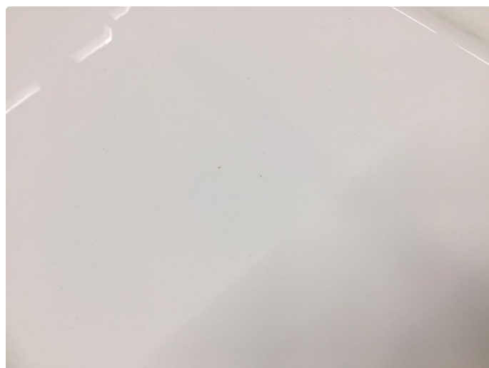
1.4 Øvrige feil