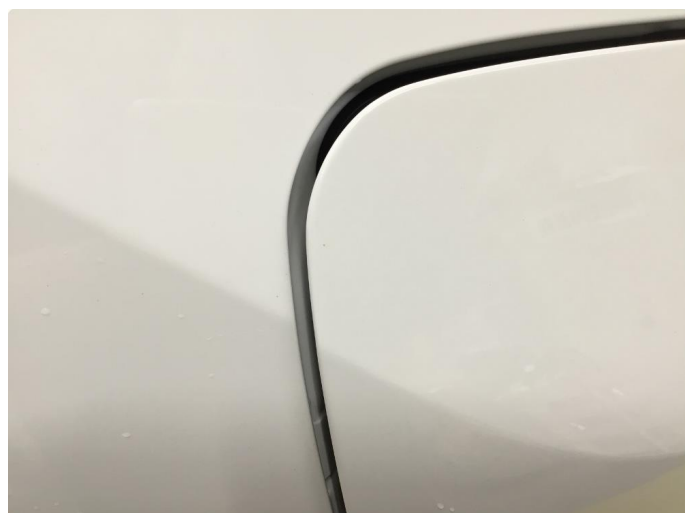
1.2 Øvrige feil