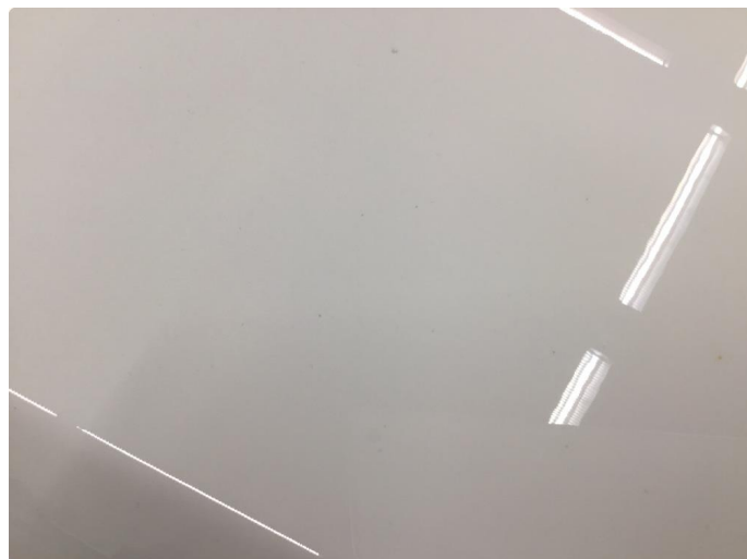
1.5 Øvrige feil