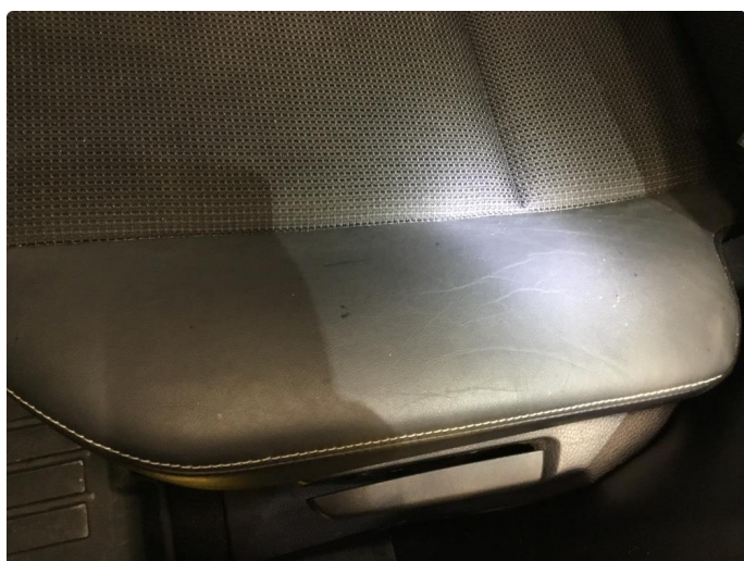
2.1 Generelt mye bruksslitasje