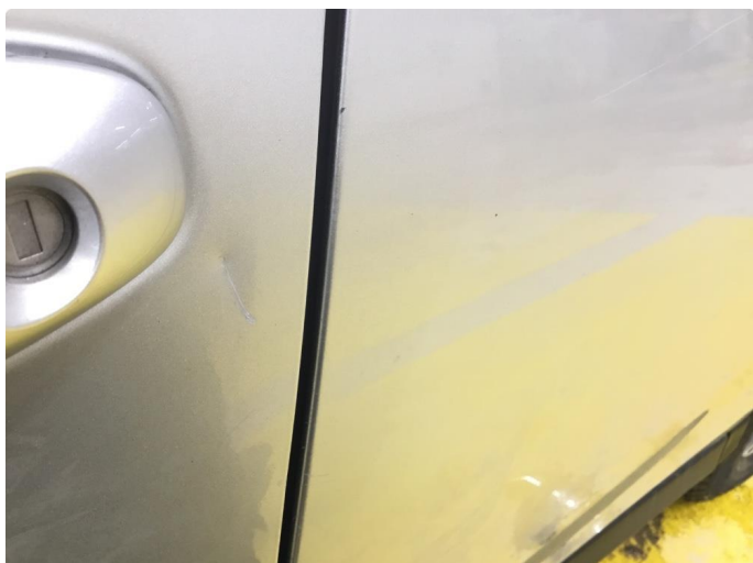
1.3 Bulk med lakkskade