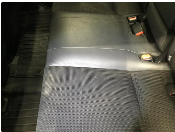
2.1 Generelt mye bruksslitasje