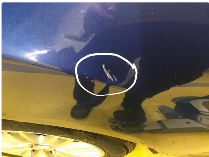
2.5 Bulk med lakkskade