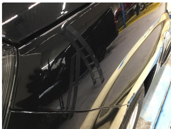
1.1 Generelt mye overflate-riper