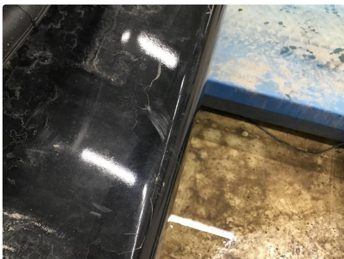
1.1 Generelt mye overflate-riper