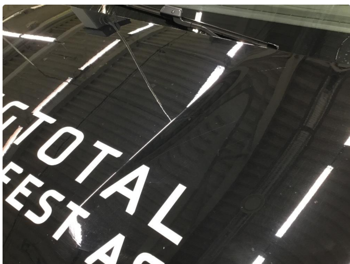
1.1 Generelt mye overflate-riper