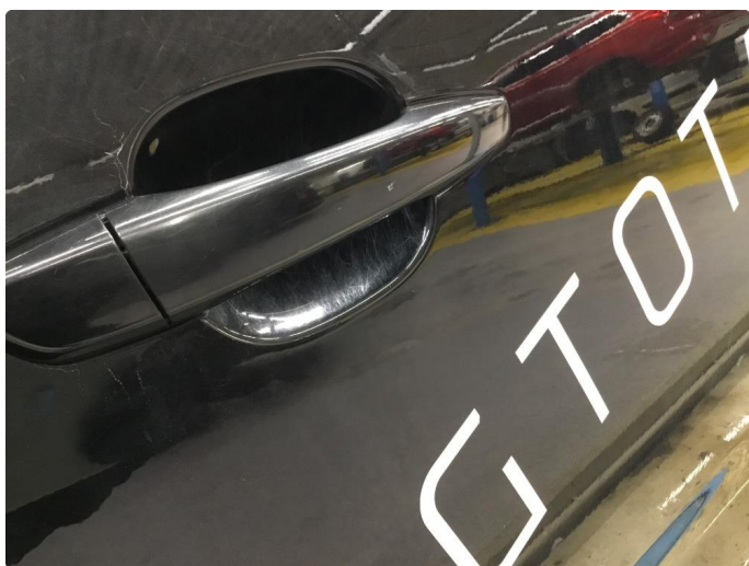
1.1 Generelt mye overflate-riper