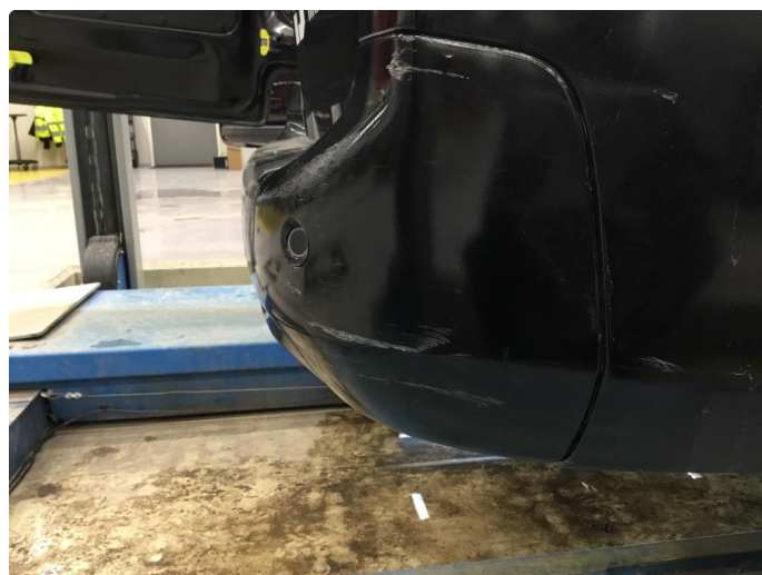
1.1 Generelt mye overflate-riper