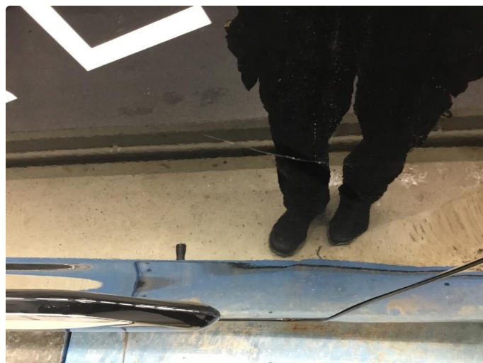
1.1 Generelt mye overflate-riper