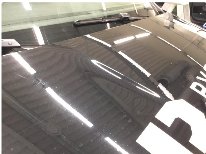
1.1 Generelt mye overflate-riper