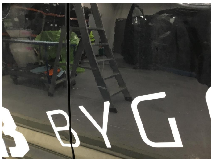
1.1 Generelt mye overflate-riper