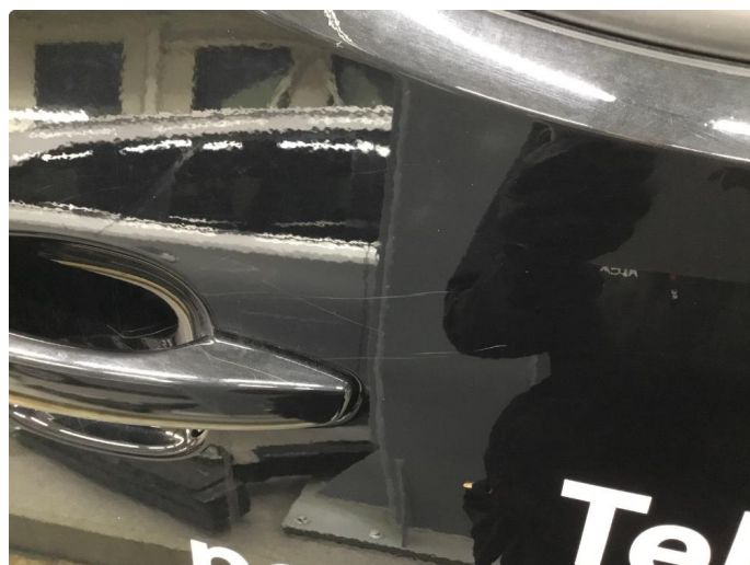
1.1 Generelt mye overflate-riper