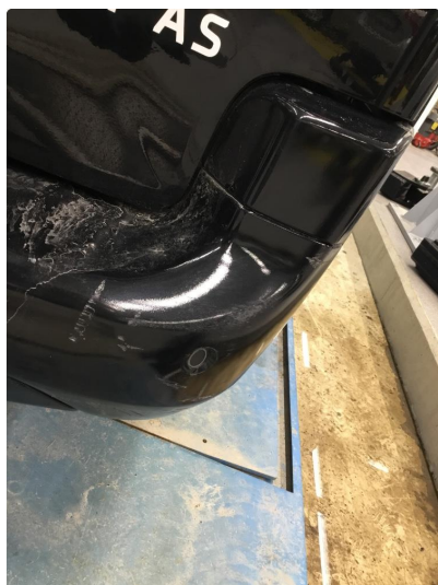
1.1 Generelt mye overflate-riper