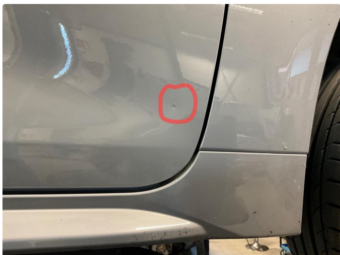
1.1 Noen småbulker og steinsprut rundt om på bilen.