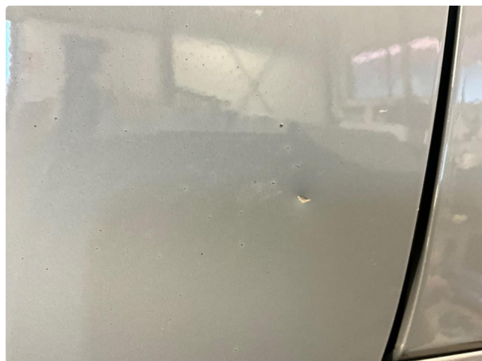
1.1 Noen småbulker og steinsprut rundt om på bilen.