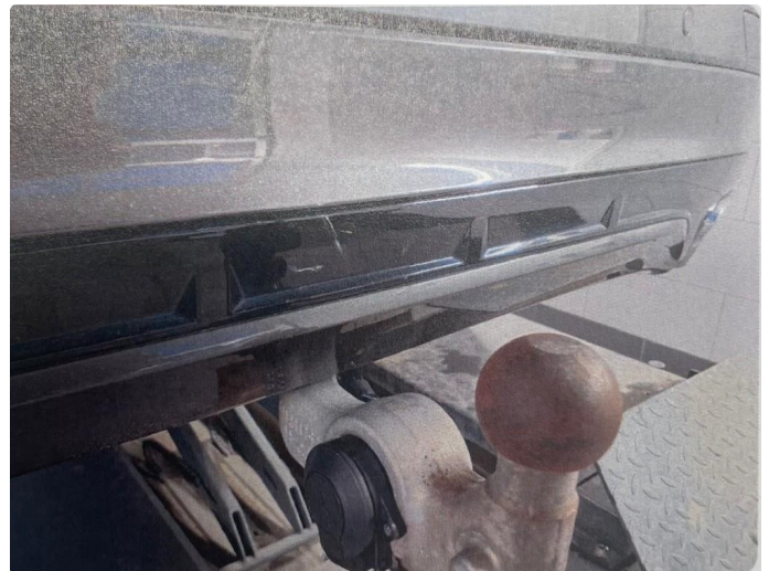
1.4 Noen riper i støtfanger