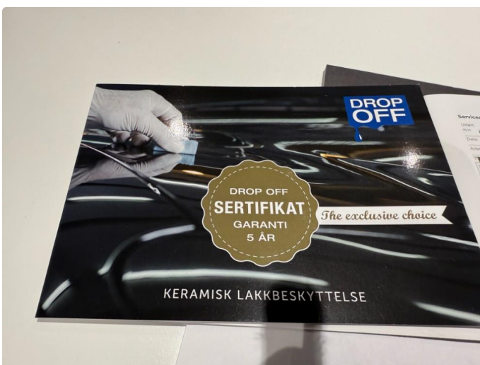
2.2 Drop Off