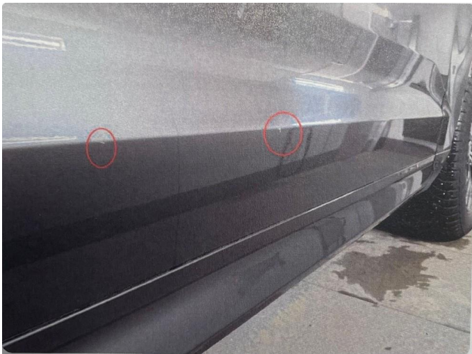
1.2 Riper i dør