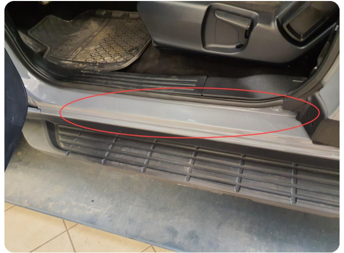
1.3 Noen riper og småbulker