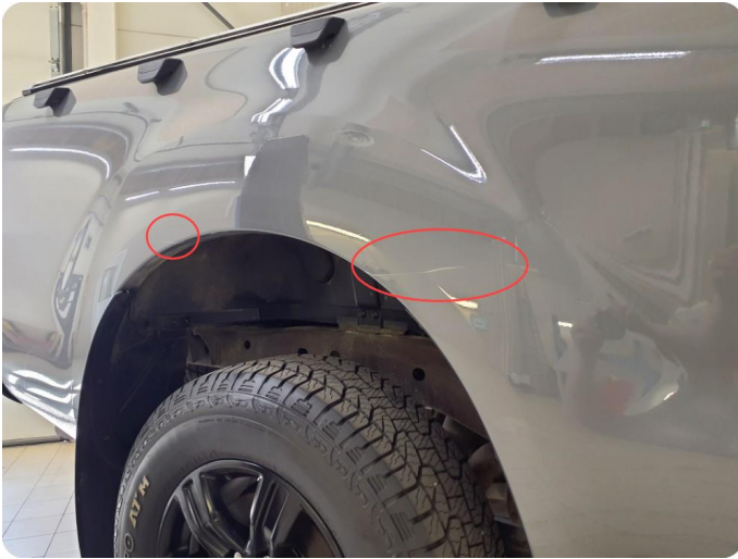
1.1 Bulk med lakkskade