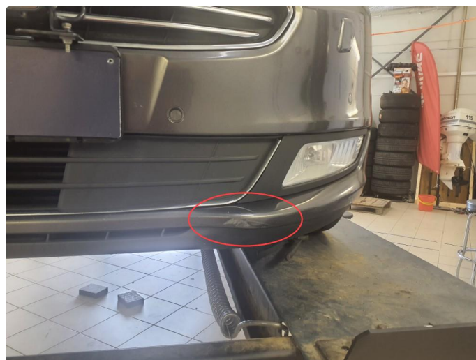
1.7 Ripe(r) ned til grunning