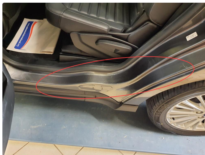
1.6 Noen riper og småbulker