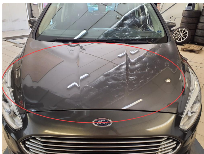
1.3 Mye stensprut