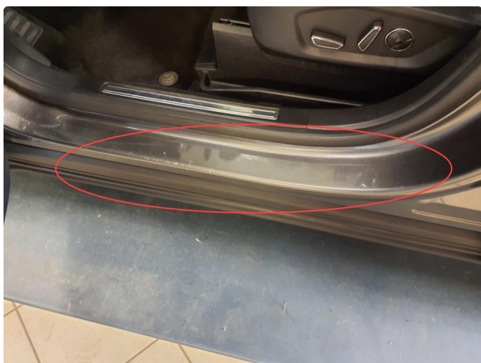
1.6 Noen riper og småbulker