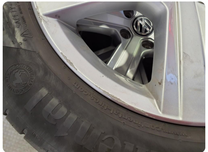
2.5 Kantkjørt felg En sommerfelg