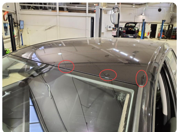
2.7 Steinsprut med rust