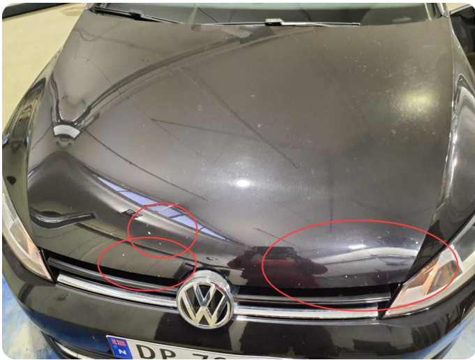
2.2 Bulk med lakkskade Ink steinsprut