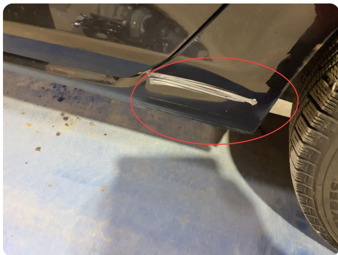
2.9 Bulk med lakkskade