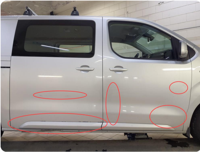
1.1 Flere bulker Riper og lakkflass