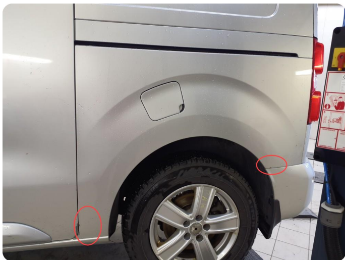
1.3 Bulk med lakkskade Bulker, Riper og lakkflass