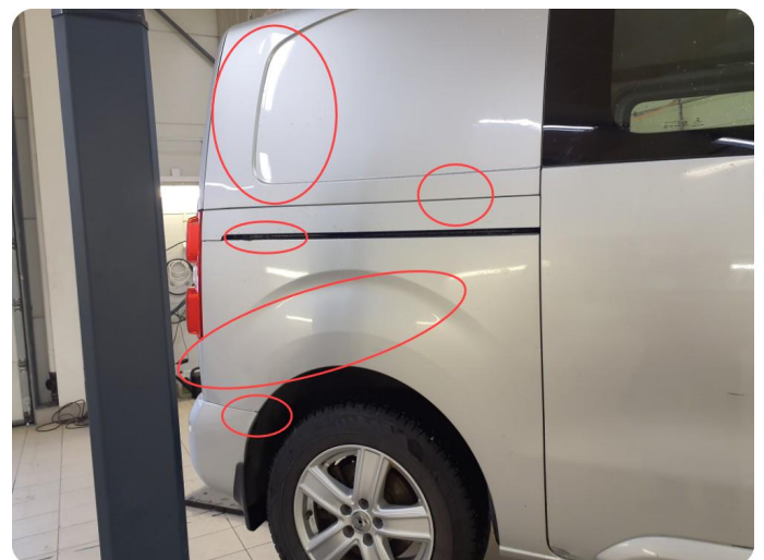
1.3 Bulk med lakkskade Bulker, Riper og lakkflass