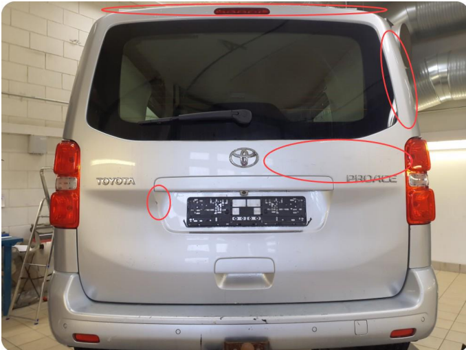
1.2 Flere bulker