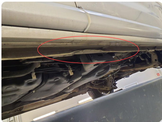
1.7 Skade I