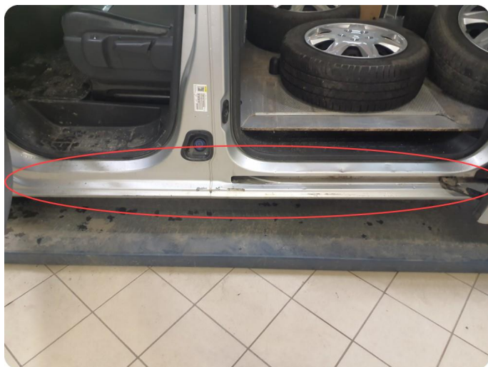
1.4 Noen riper og småbulker