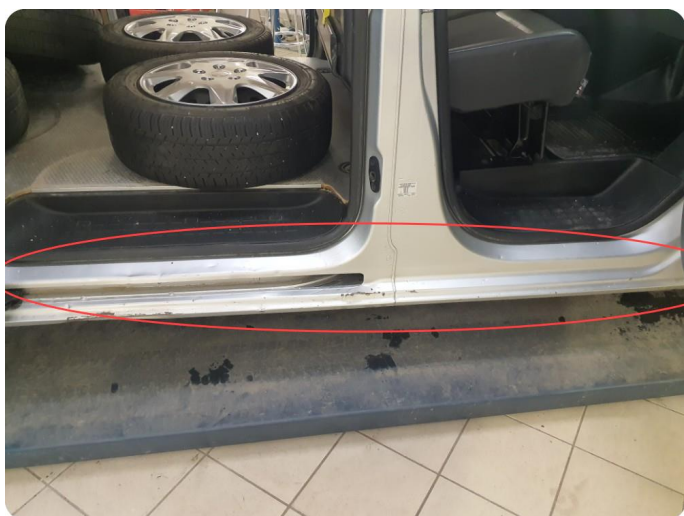
1.4 Noen riper og småbulker