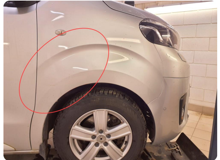
1.3 Bulk med lakkskade Bulker, Riper og lakkflass