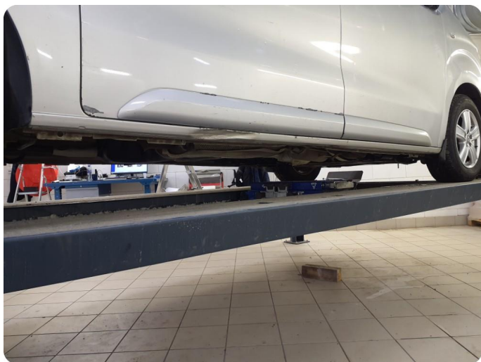
1.7 Skade I