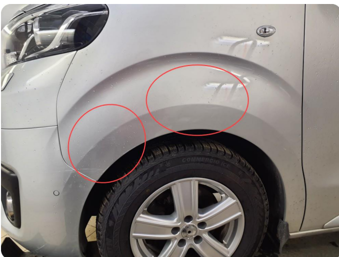
1.3 Bulk med lakkskade Bulker, Riper og lakkflass