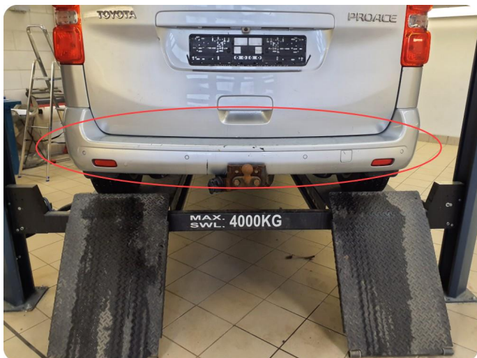
1.6 Ripe(r) ned til grunning