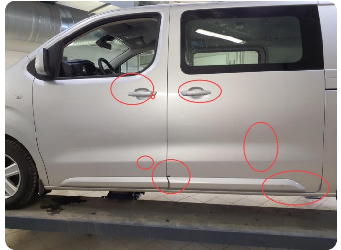
1.1 Flere bulker Riper og lakkflass