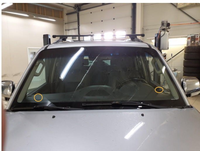
3.8 Steinsprut med sprekk