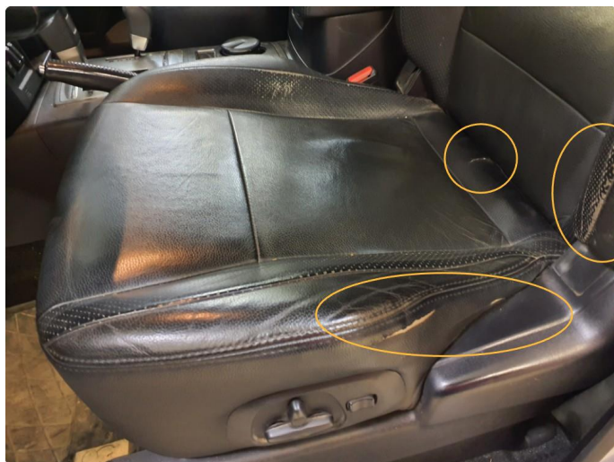
5.1 Skade på setepute