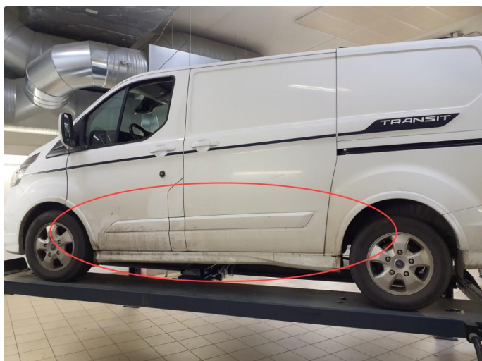
2.1 Lakk flasser