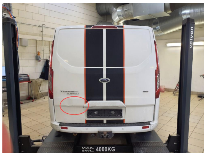
2.4 Bulk med lakkskade