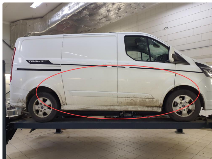
2.1 Lakk flasser