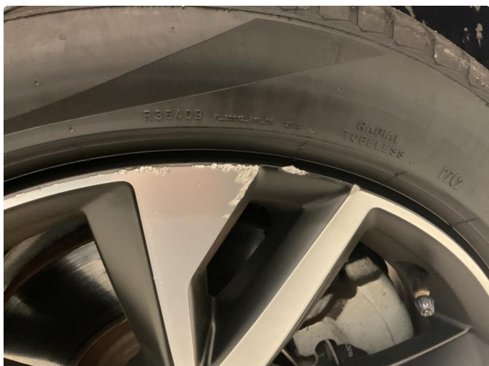
1.2 Kantkjørt felg