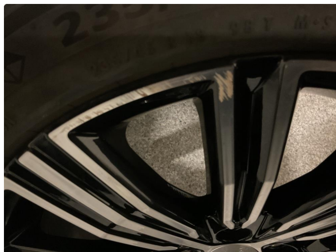
1.3 Kantkjørt felg