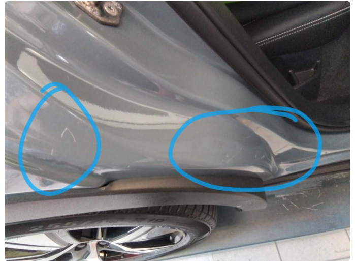
1.2 Riper, polere