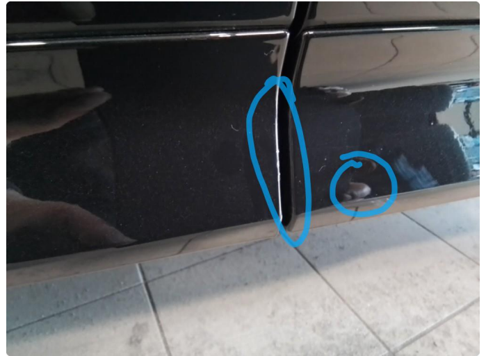
1.3 Ripe, kan poleres