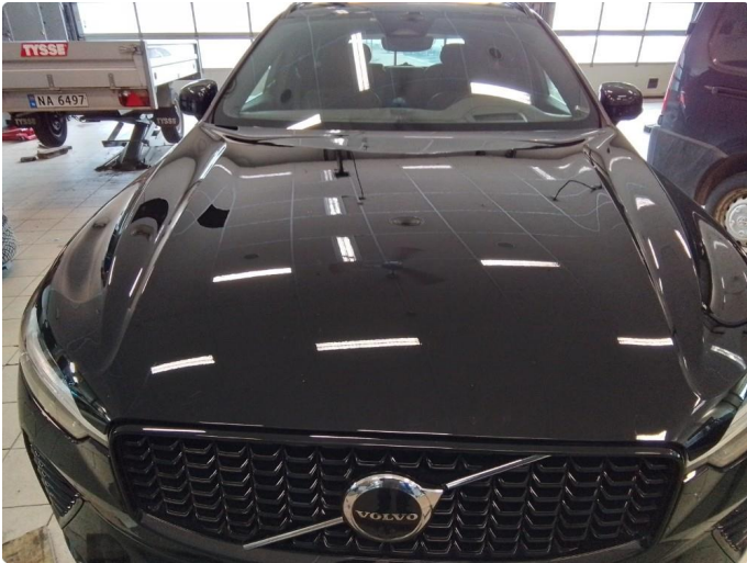
1.2 Steinsprut, legge i lakkstift