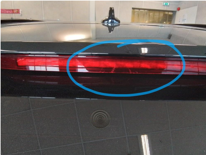
2.1 Defekt / sprukket glass, byttes