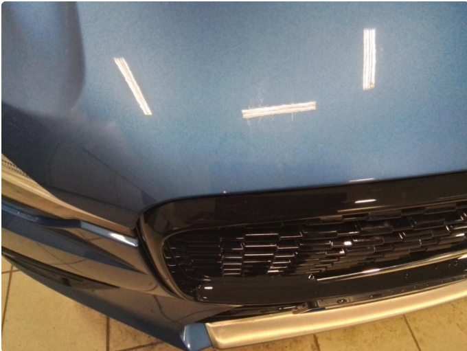
1.1 Steinsprut, lakkstift