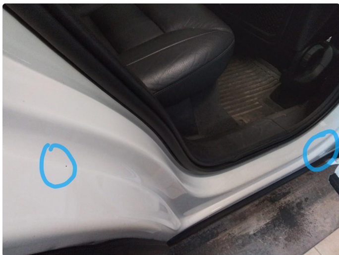
1.4 Litt slitasje