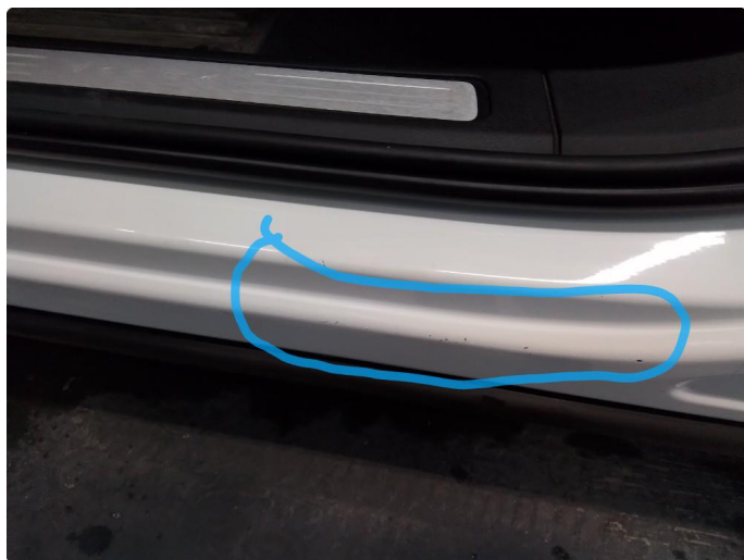
1.4 Litt slitasje