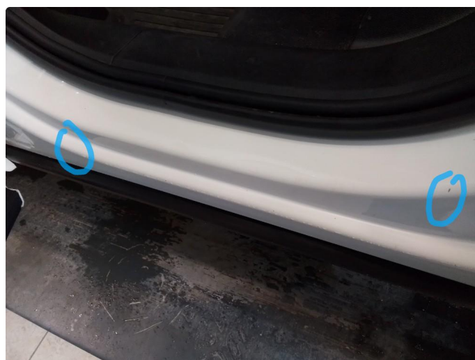
1.4 Litt slitasje