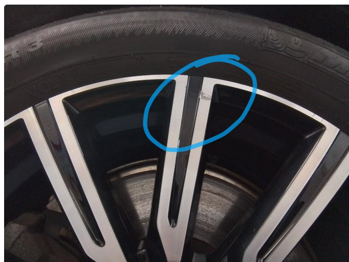
1.3 Kantkjørt felg Diamond Cut