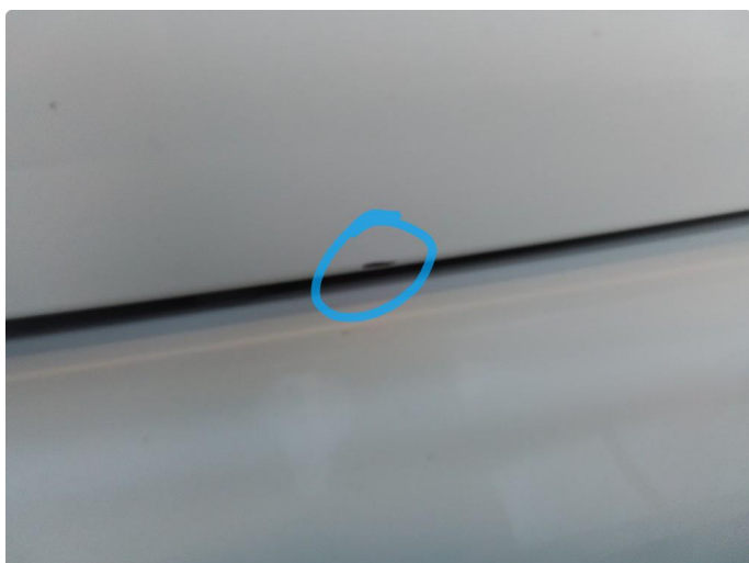
1.2 Liten ripe