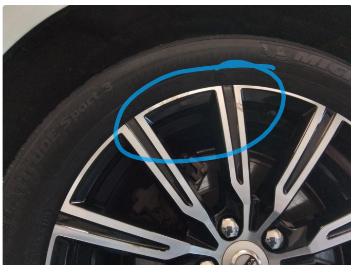
1.3 Kantkjørt felg Diamond Cut