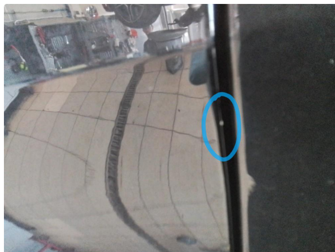
1.1 Steinsprut, lakkstift