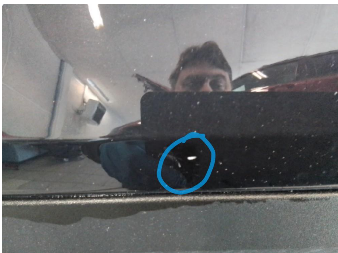
1.1 Steinsprut, lakkstift