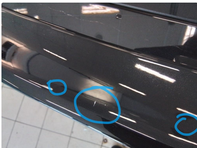
1.2 Steinsprut, lakkstift