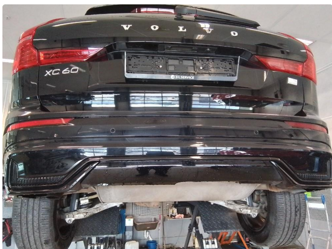
1.2 Riper, polering