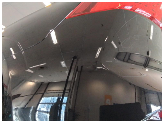
1.2 Riper, polering