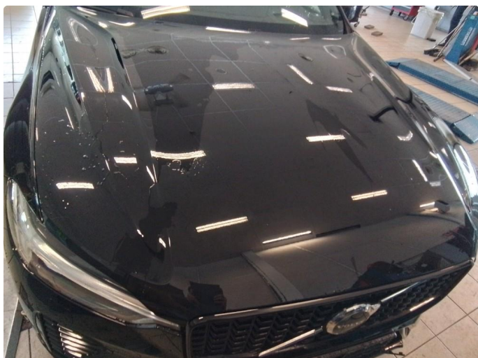
1.1 Steinsprut, lakkstift