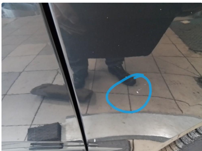
1.3 Steinsprut, Lakkstift