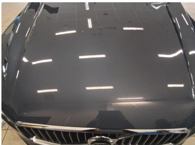
1.1 Steinsprut, Lakkstift