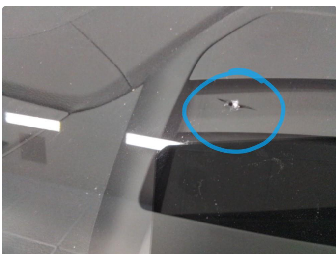
1.5 Steinsprut, Rep