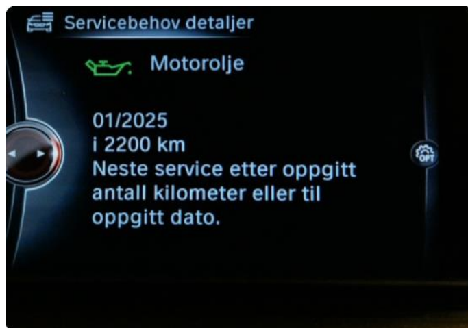
2.1 Neste service 01.2025/4.400km. Bilen har en aktiv serviceavtale til bilen er 10år eller har gått 150.000km, hva som først inntreffer.

Fordon BMW X1 XDRIV A, 110kW WBAHT9109H5FZ3576