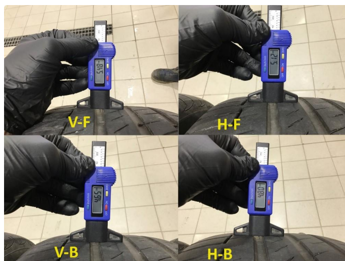
1.2 Mønsterdybde sommerdekk målt ved takst 09.04.24, 113.764km.