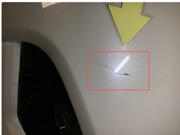
1.7 Noe riper / sår h+v side frontfanger ( Poleres / Flekkes )