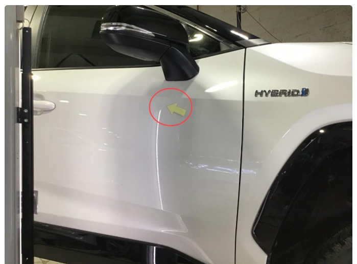
1.2 Liten p-bulk h-framdør.