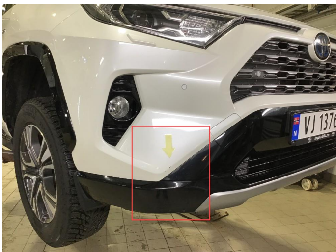
1.7 Noe riper / sår h+v side frontfanger ( Poleres / Flekkes )