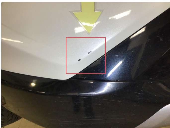
1.7 Noe riper / sår h+v side frontfanger ( Poleres / Flekkes )