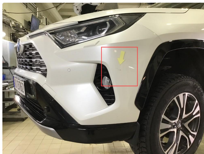
1.7 Noe riper / sår h+v side frontfanger ( Poleres / Flekkes )