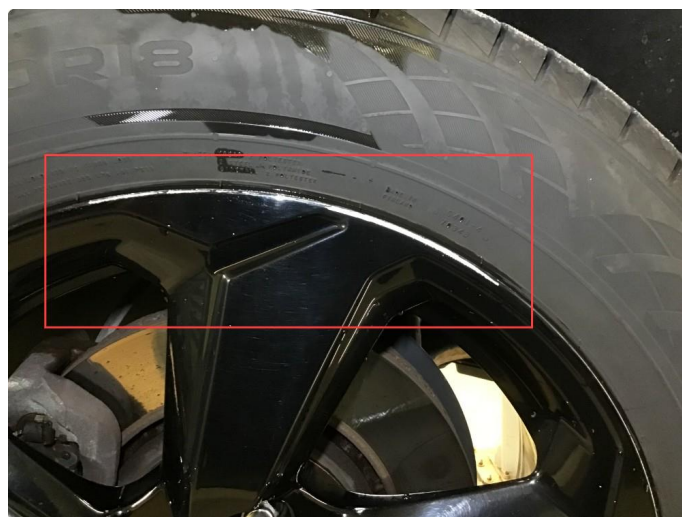
1.3 Noe bruksmerke på 1 sommerfelg.