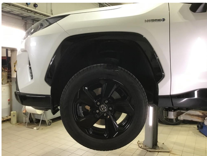
1.3 Noe bruksmerke på 1 sommerfelg.