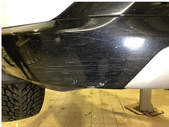
1.7 Noe riper / sår h+v side frontfanger ( Poleres / Flekkes )