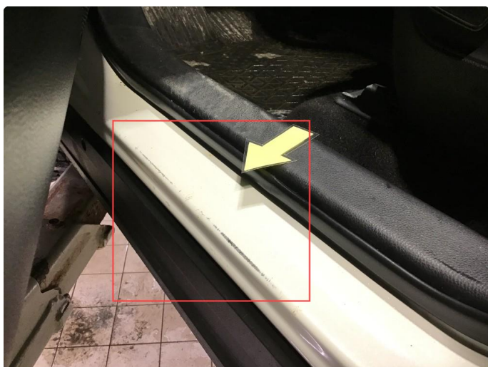
1.6 Noen riper/slitasje i døråpning førerdør, flekkes og poleres.