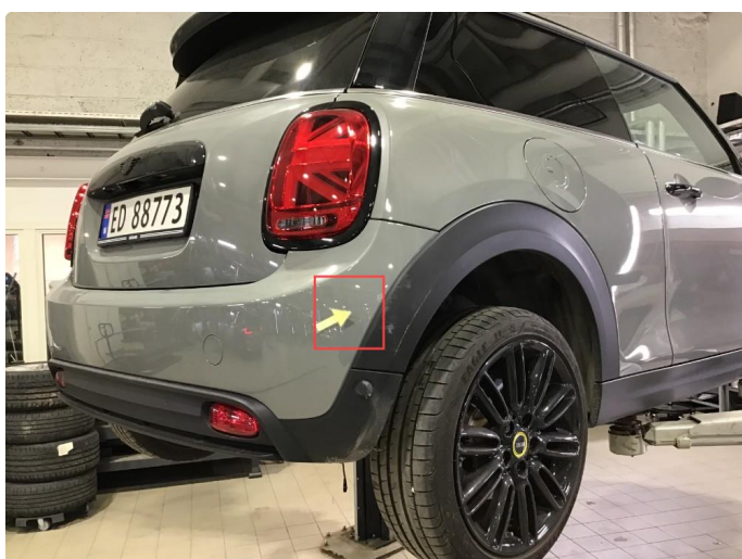
1.5 Lakksår h-side bakfanger, flekkes og poleres.