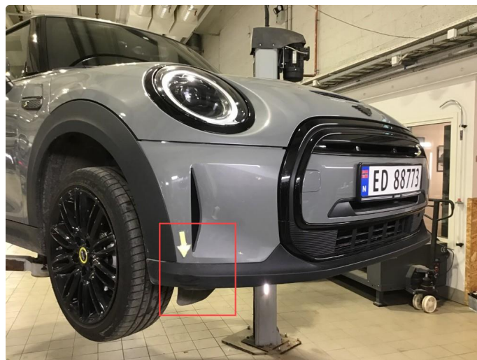
1.4 Noe riper / skrubbermerker nedre del frontfanger h-side, poleres.