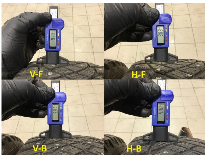
1.3 Mønsterdybde vinterdekk målt ved takst 25.10.2024, 8.411km.