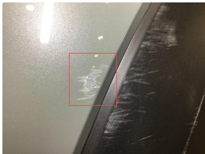
1.5 Lakksår h-side bakfanger, flekkes og poleres.