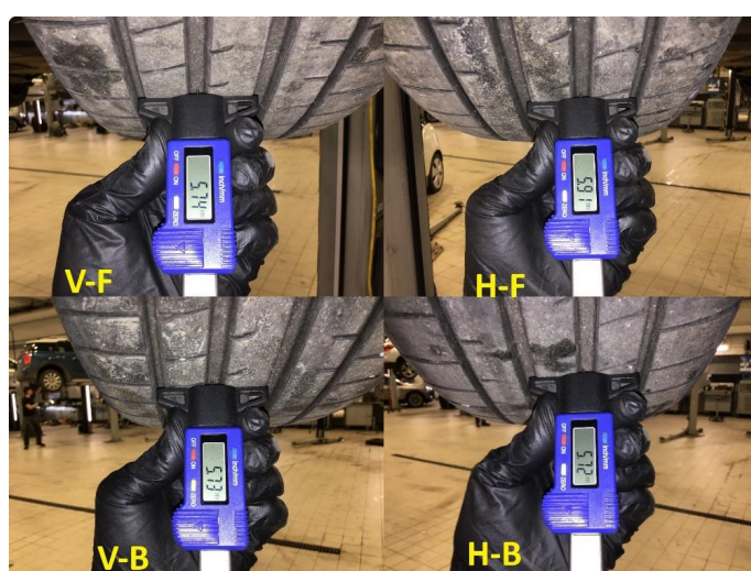
1.2 Mønsterdybde sommerdekk målt ved takst 25.10.2024, 8.411km.