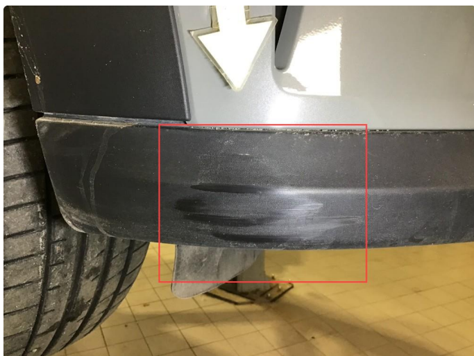
1.4 Noe riper / skrubbermerker nedre del frontfanger h-side, poleres.