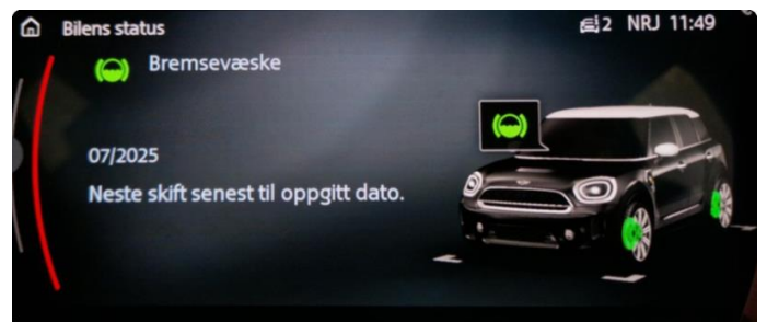
2.1 Neste service 07/2025. Bil har en aktive serviceavtale til bilen er 3år eller har gått 40.000km, hva som først inntreffer.