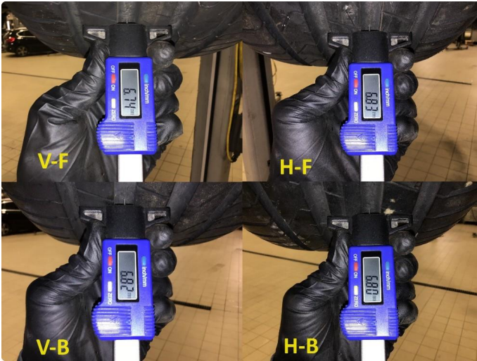
1.1 Mønsterdybde sommerdekk målt ved takst 10.07.2024, 24.586km.