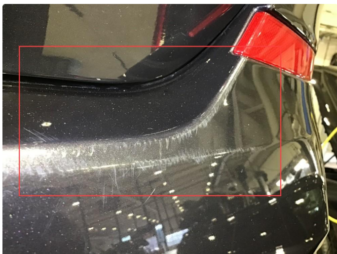
1.5 Noe bruksriper, poleres.