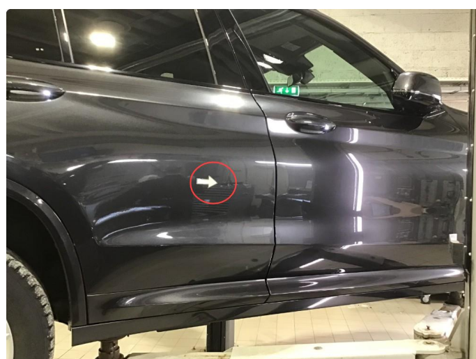
1.2 Liten p-bulk h-bakdør, regnes som normal bruksslitasje.