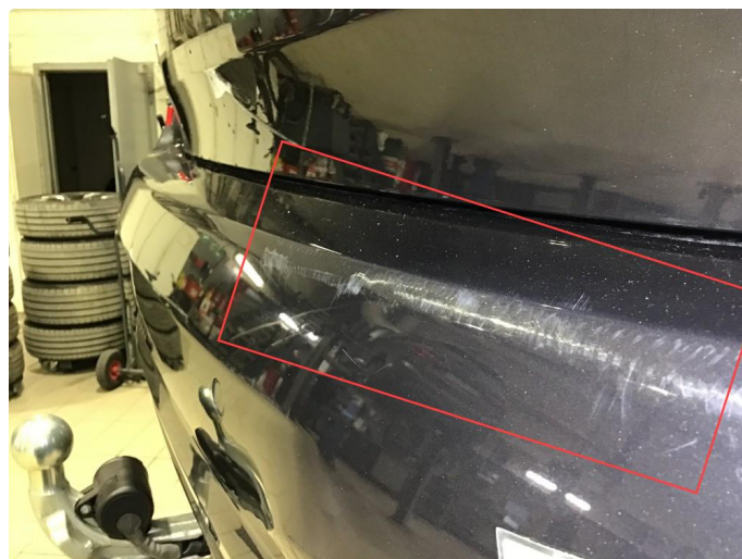
1.5 Noe bruksriper, poleres.