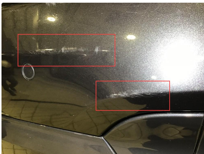
1.5 Noe bruksriper, poleres.