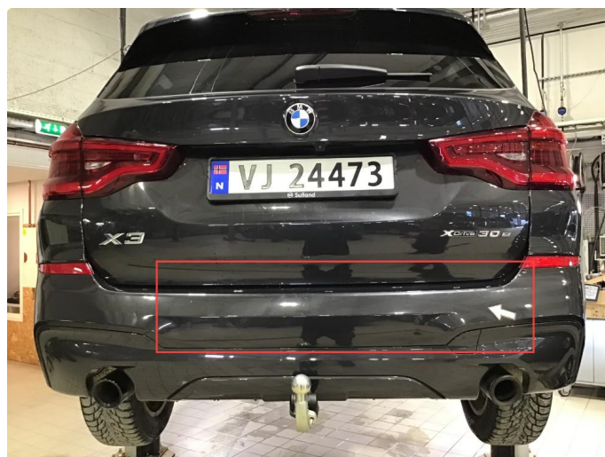
1.5 Noe bruksriper, poleres.