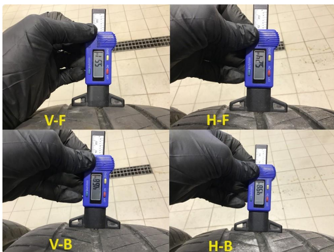
1.3 Mønsterdybde sommerdekk målt ved takst 07.03.24, 36.493km.