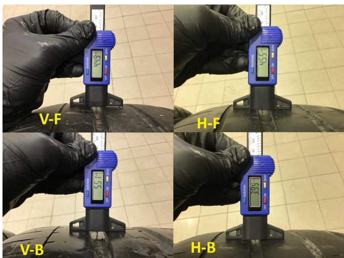
1.4 Mønsterdybde sommerdekk målt ved takst 23.12.2024, 45.128km.