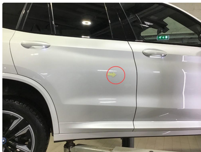
1.2 Liten p-bulk høyre bakdør, regnes som normal bruksslitasje.