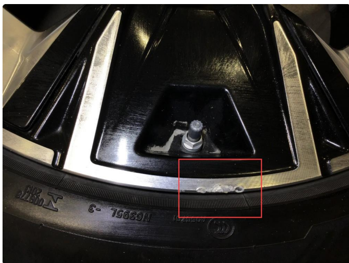
1.3 Noe bruksmerker på 1 sommerfelg.