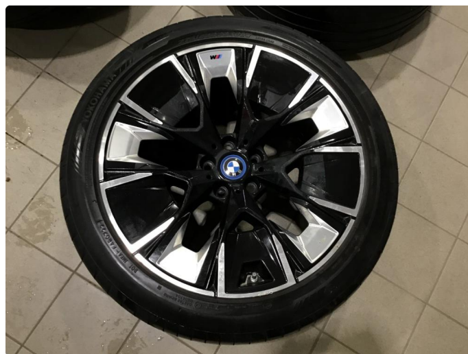
1.3 Noe bruksmerker på 1 sommerfelg.