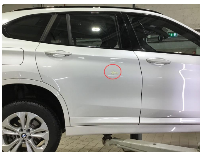
1.2 Liten p-bulk h-bakdør, regnes som normal bruksslitasje.