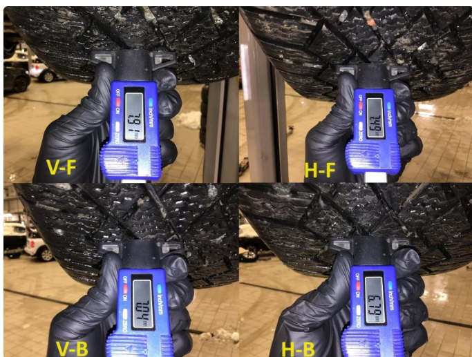
1.3 Mønsterdybde vinterdekk målt ved takst 13.12.23, 39.475km.