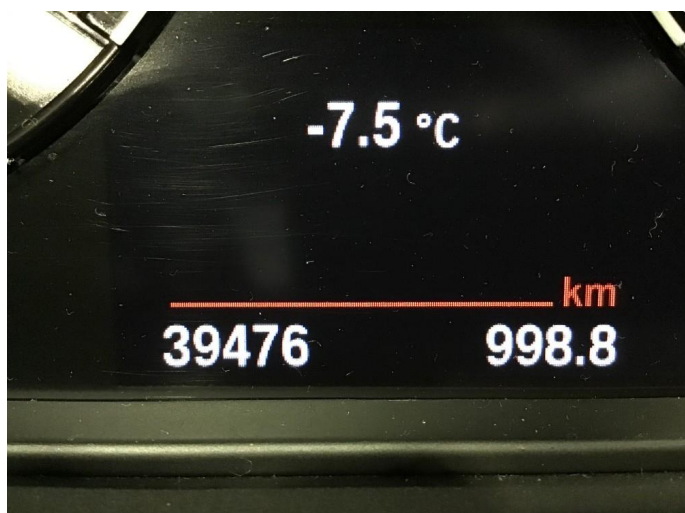
1.1 Oversiktsbilde av bilen.