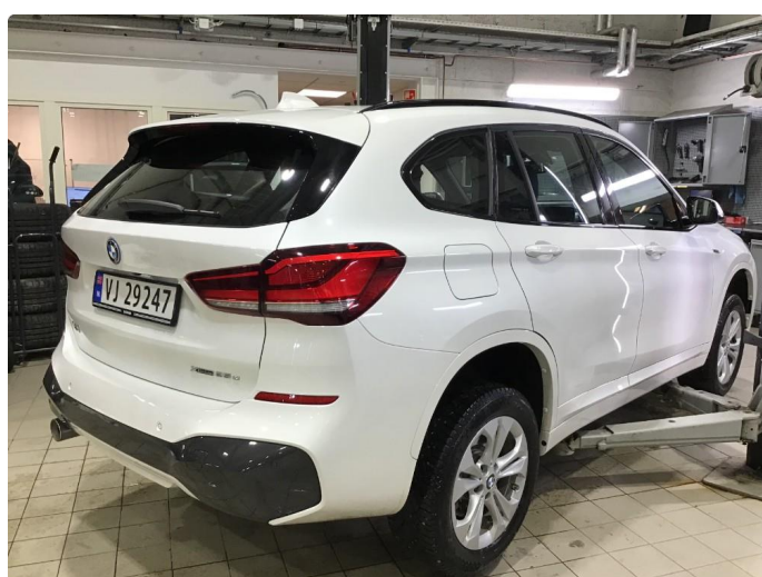
1.1 Oversiktsbilde av bilen.