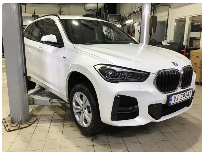
1.1 Oversiktsbilde av bilen.