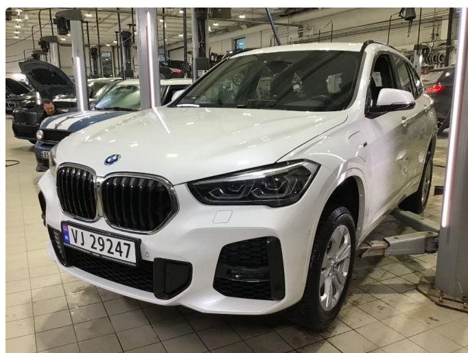
1.1 Oversiktsbilde av bilen.