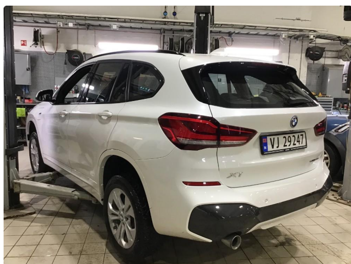
1.1 Oversiktsbilde av bilen.