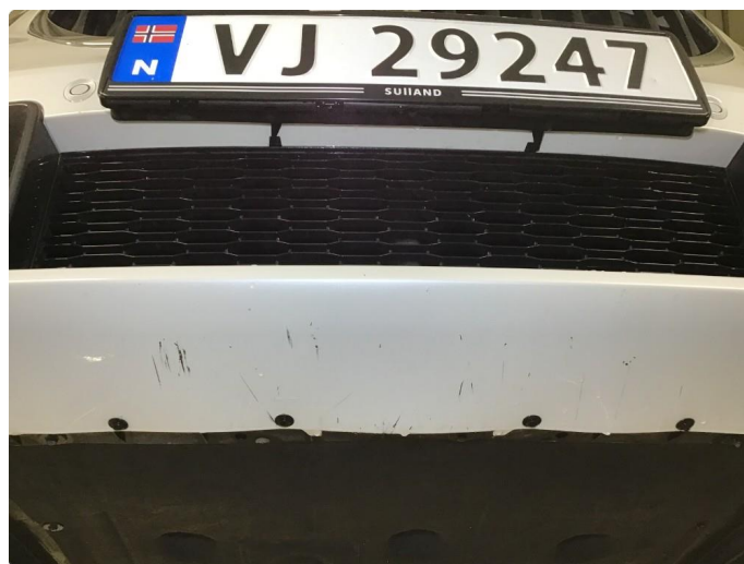
1.5 Noen skrubbermerker underkant fremfanger, regnes som normal bruksslitasje.