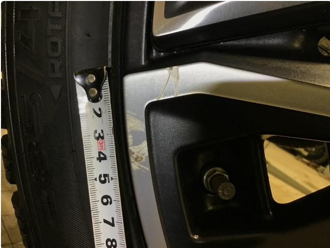
1.1 Bruksmerker på 1 vinterfelg.