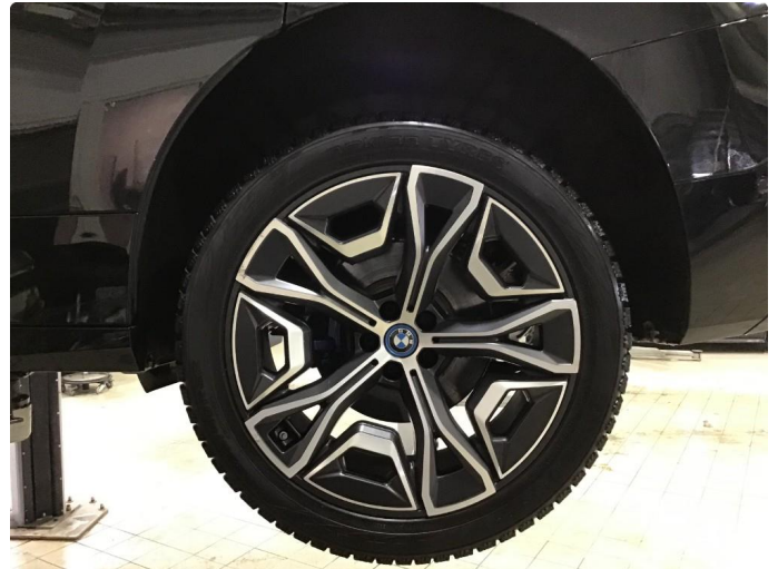
1.1 Bruksmerker på 1 vinterfelg.