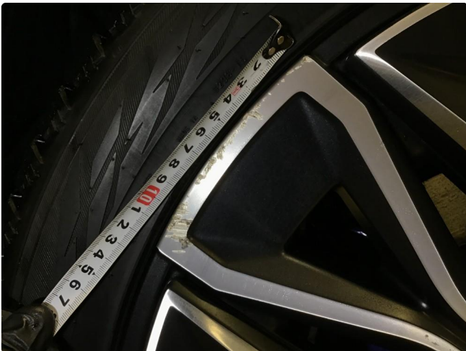
1.1 Bruksmerker på 1 vinterfelg.