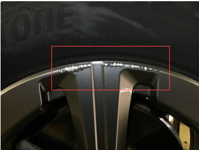
1.2 Bruksmerke på 1 sommerfelg.