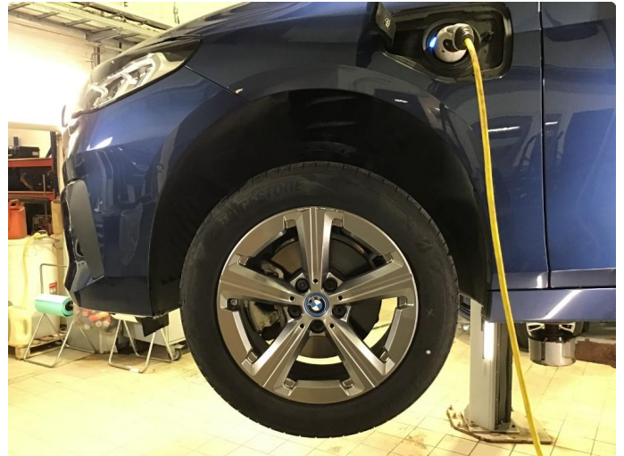
1.2 Bruksmerke på 1 sommerfelg.