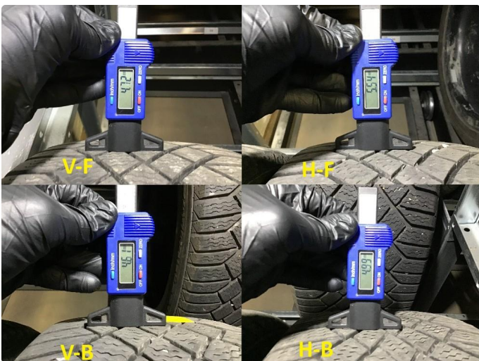
1.4 Mønsterdybde vinterdekk målt ved takst 17.09.2024, 49.526km.