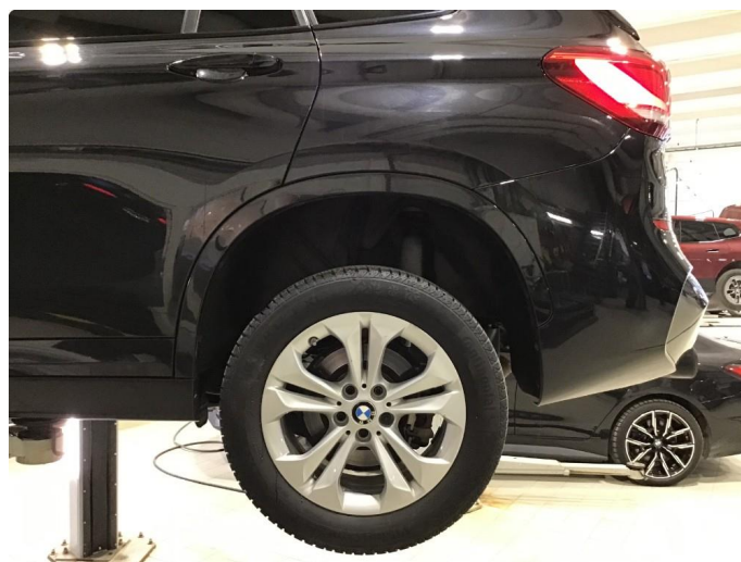
1.3 Noen bruksmerker på 1 vinterfelg.