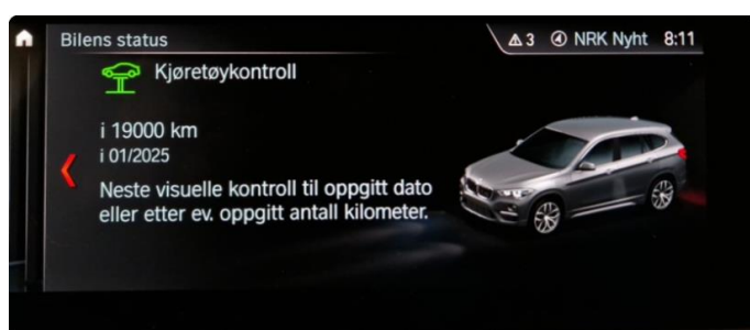
2.1 Neste service 01.2025/19.000km.