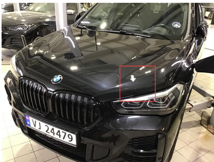
1.2 Noe steinsprut på panser, flekkes.