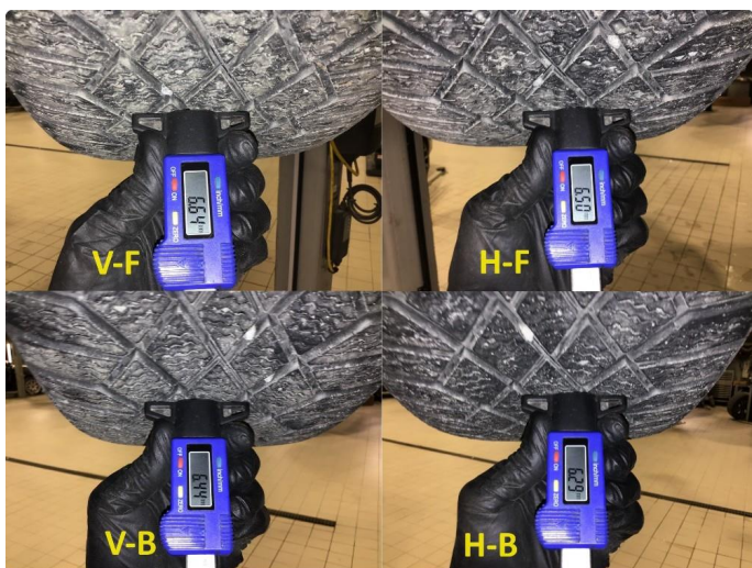
1.5 Mønsterdybde vinterdekk målt ved takst 19.03.24, 51.364km.