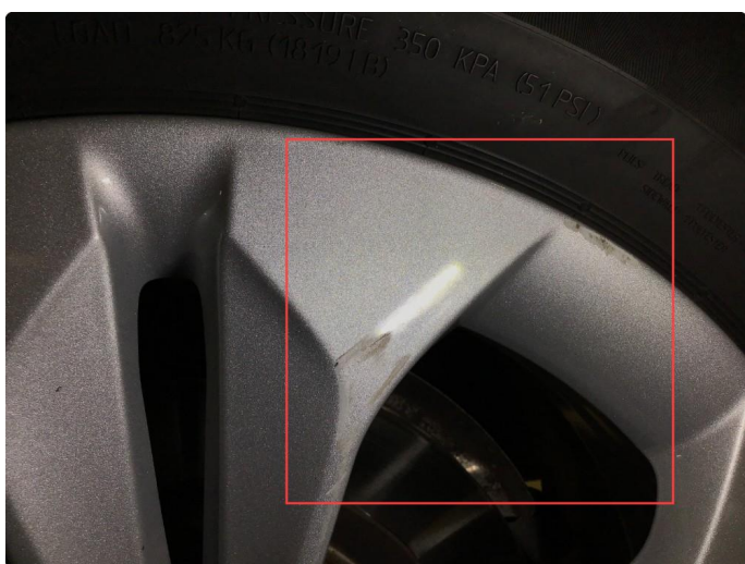
1.3 Noen bruksmerker på 1 vinterfelg.