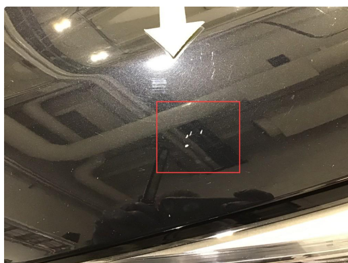
1.2 Noe steinsprut på panser, flekkes.