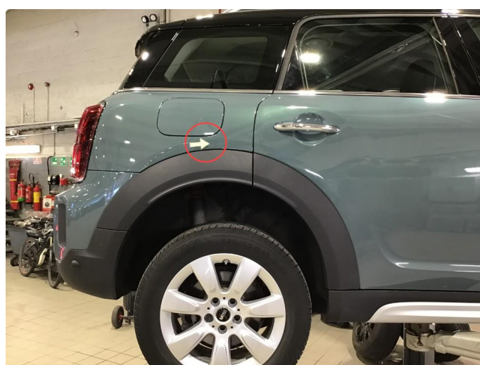
1.2 Liten p-bulk h-bakskjerm, regnes som normal bruksslitasje.