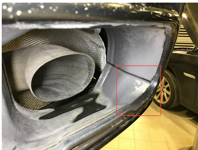
2.1 Lakklass på endestusser, skiftes på garanti.