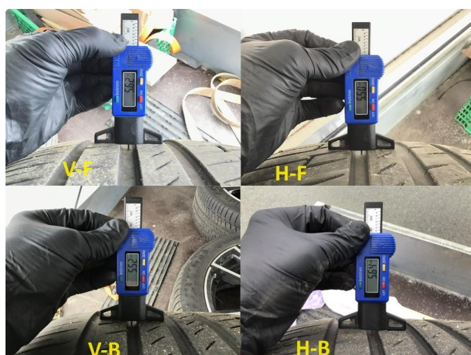
1.2 Mønsterdybde sommerdekk målt ved takst 02.04.24, 19.415km.