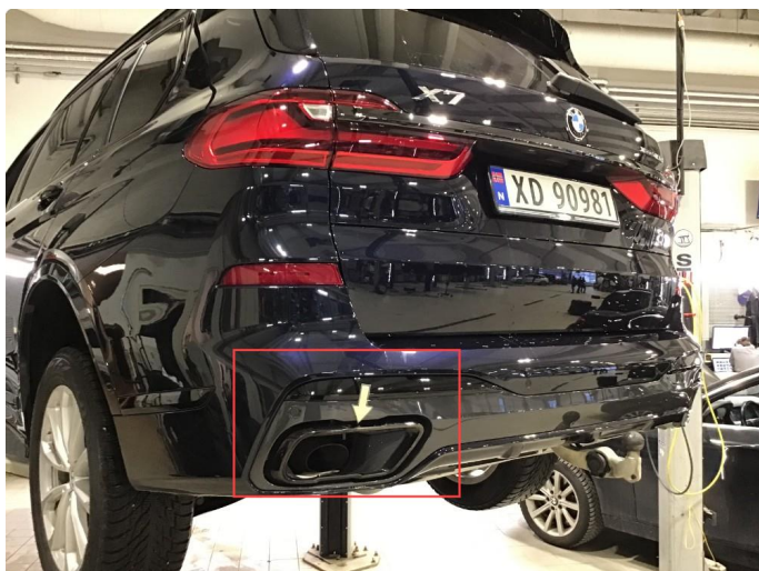
2.1 Lakklass på endestusser, skiftes på garanti.