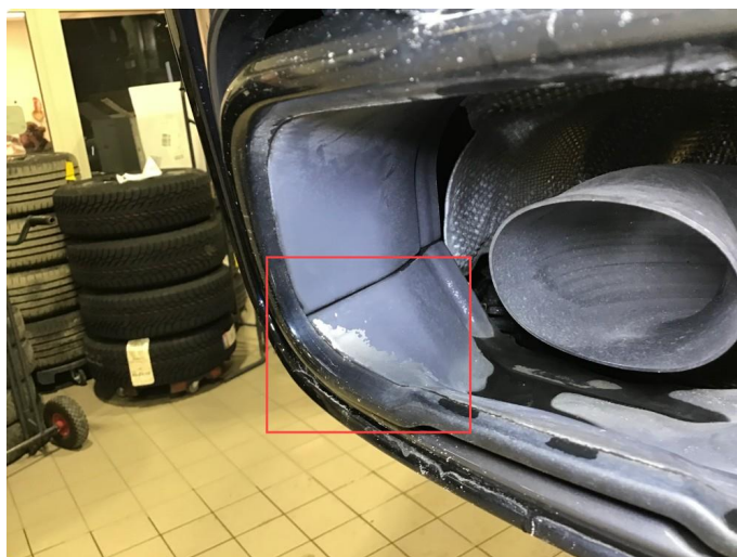
2.1 Lakklass på endestusser, skiftes på garanti.