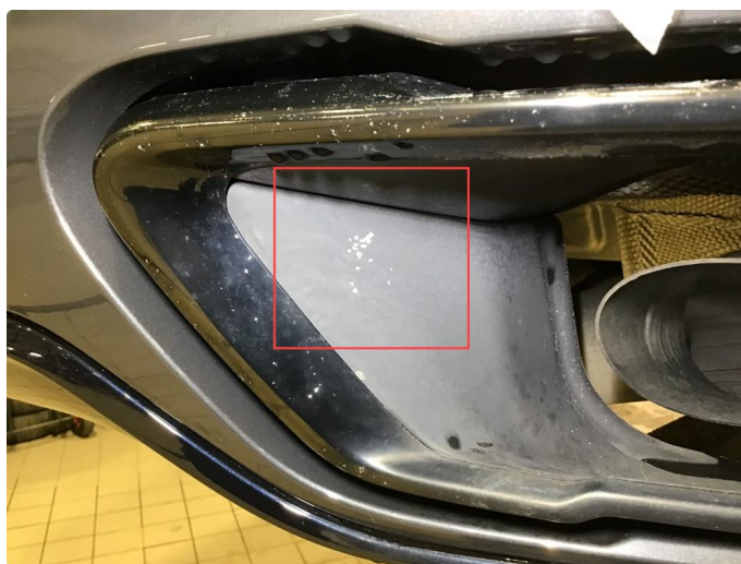
2.1 Lakklass på endestusser, skiftes på garanti.