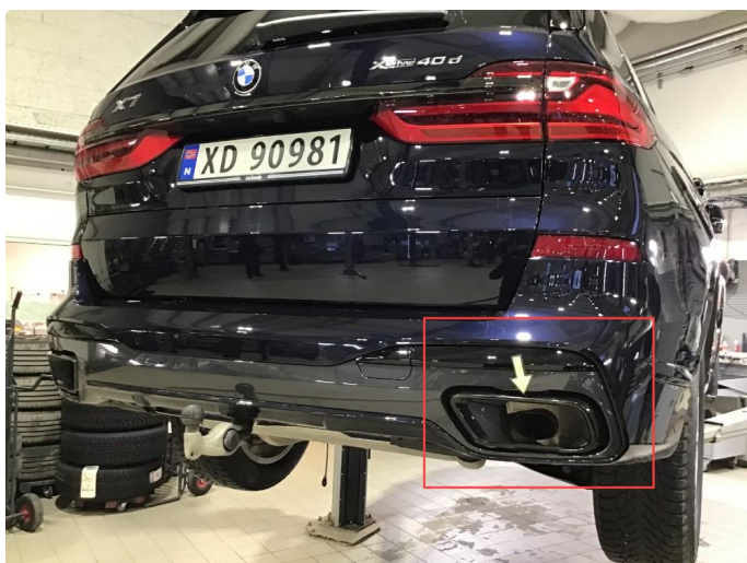
2.1 Lakklass på endestusser, skiftes på garanti.