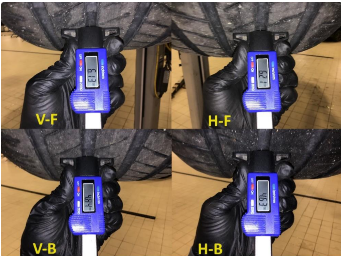
1.2 Mønsterdybde sommerdekk målt ved takst 12.07.2024, 54.289km.