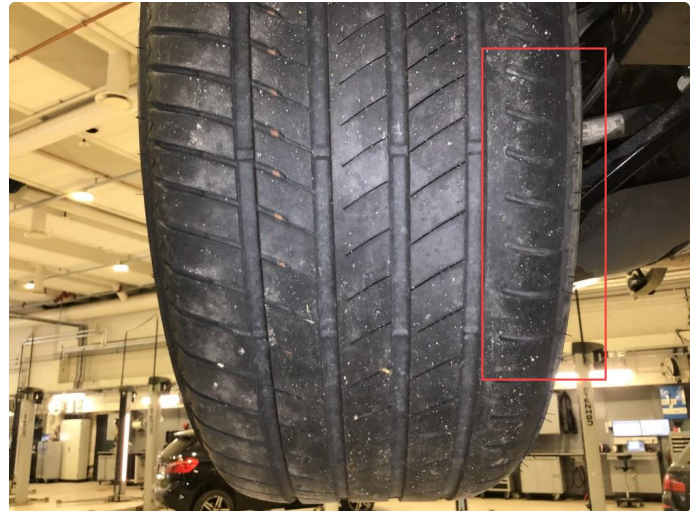
1.1 Noe skjev slitasje på sommerdekk bak.